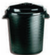
IM80298 Cubo comunidad Tapa incluida 45,5 x 52 x 46,5 cm - 50 litros