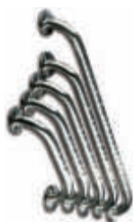
AV40320 Barra manillón 30 cm. Inox. brillo