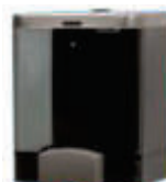
AC21150 Dispensador jabón Visión Fumé - 1,4 litros 16,5 x 13 x 12 cm