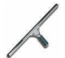
TTS8052 Limpiacristales inox. completo 35 cm.