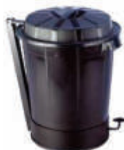
IM23190 Cubo comunidad con pedal Tapa incluida 59 x 51,5 x 79 cm. - 95 litros