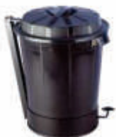
IM23210 Cubo comunidad con pedal Tapa incluida 55 x 48,5 x 58 cm. - 50 litros