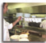
SJCK6536A Porta comandas 5,1 x 91,5 x 1,9 cm.