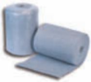
BP1413 Bobina punto azul 1 x 6,50 metros - Pack de 6 unidades