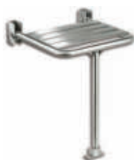
AV00030 Asiento abatible Acero inox. brillo 18/10 30 x 40 cm. Con soporte a suelo