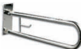
AV10840 Barra abatible con portarollos Inox. brillo 80 x 20 cm