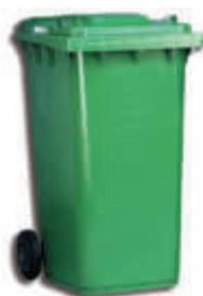
ALPO330 Contenedor con ruedas 66 x 87 x 108 cm. - 330 litros