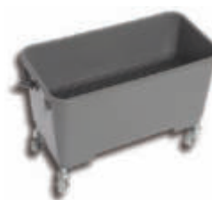
PLX3500 Cubo lavado y encerado 56 L 56 x 29x 36 cm