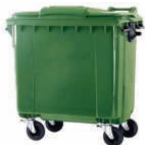
ALPO660 Contenedor Maxi 116 x 126 x 72 cm. - 600 litros