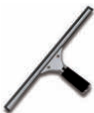
IMX1400 Limpiacristales inox. completo 25 cm.