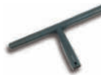
IMX3310 Soporte mojador 35 cm. Plástico