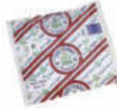
MO670439-1 Bayeta microfibra profesional blanca 1 unidad