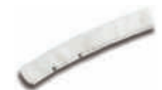
IMX3320 Recambio mojador 35 cm. Para IMX3310