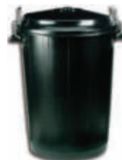
IM90161 Cubo comunidad Tapa incluida 52 x 62x 65 cm. - 100 litros