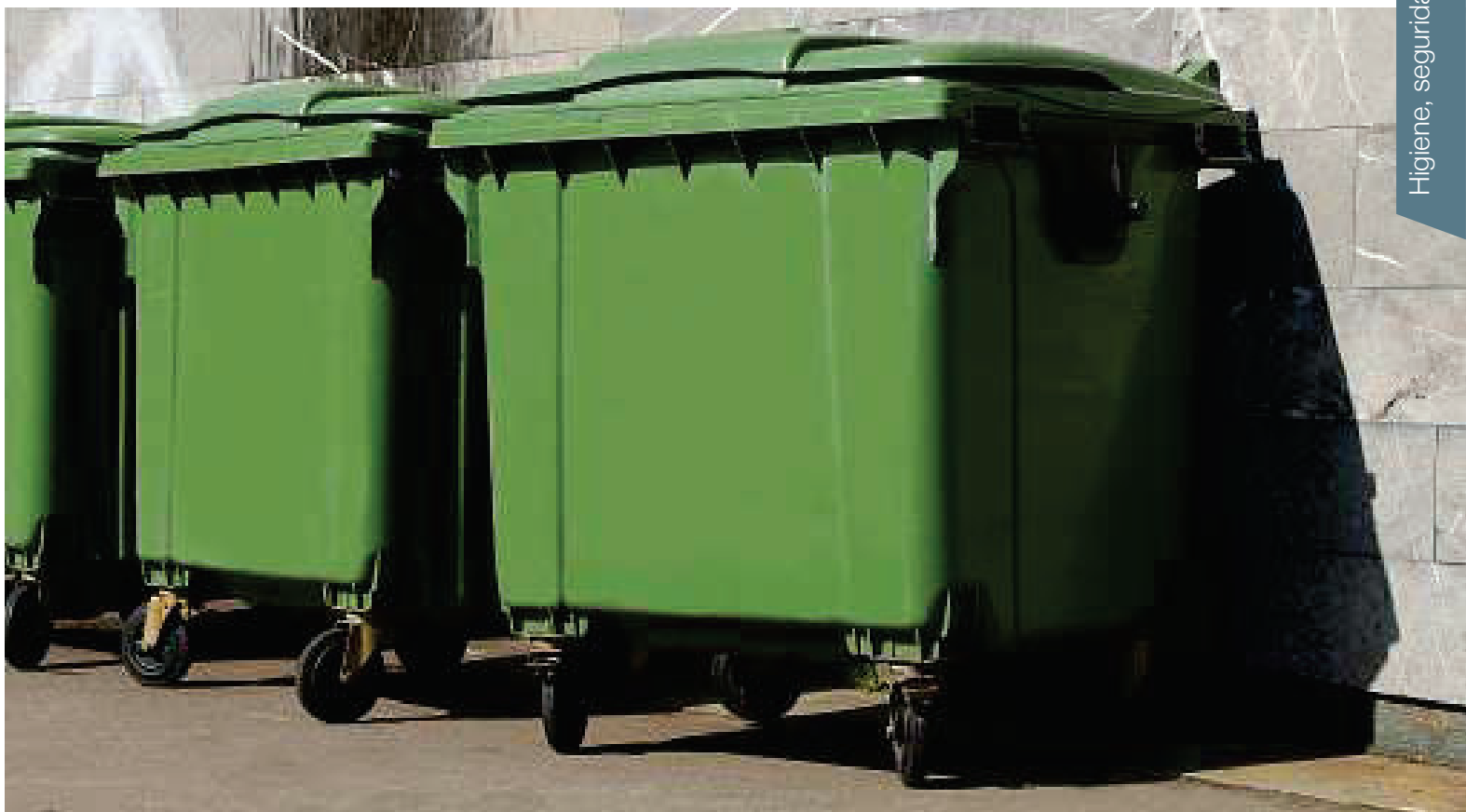
ALPO1100 Contenedor Maxi 130 x 127 x 107 cm. - 1.000 litros