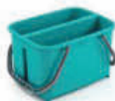
TTS3512 Cubo escurridor 2 Senos de 11 litros - No incluye ruedas