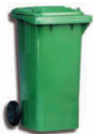
ALPO240 Contenedor con ruedas 58 x 73 x 108 cm. - 240 litros