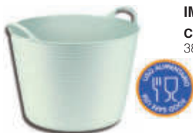
IM36036 Capazo Alimentación 38 litros - Apto para la industria alimentaria