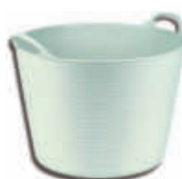
IMCES38B Capazo blanco Blanco - 38 litros