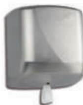
AG45500 Toallero mecha Inox. brillo 33 x 24 x 25,5 cm