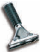
TTS8190 Rascador inox. Sin soporte ni cuchillas