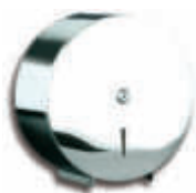
AE21900B Portarrollos higiénico industrial Inox. brillo - Ø 26,5 x 12 cm.