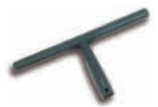
TTS8391 Soporte mojador 35 cm.