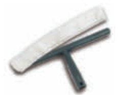
IMX3300 Mojador Completo 35 cm. Plástico