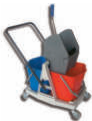
PLS1650 Cubo doble 2 x 17 litros - Prensa