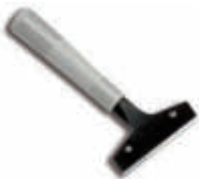
IMX7100 Rascador de empuñadura Con cuchilla incorporada - Plástico