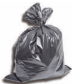
IB52*60N Bolsa basura 52 x 60 negra Galga 90 micras - 50 x 25 = 1.250 bolsas