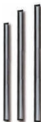
IMX1450 Recambio soporte y goma 25 cm. Para IMX1400