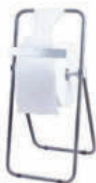
AD30000 Dispensador industrial trípode 40,5 x 46 x 84 cm. Fabricado en tubo de acero de 20 mm. Sierra frontal para corte de la celulosa