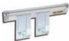
SJCK6512A Porta comandas 5,1 x 30,5 x 1,9 cm.