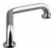
AV5010SBB Barra ducha ángulo 135° Inox brillo - 39,3 cm.