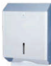
AH12200 Toallero Z Inox. brillo - 25 x 12,5 x 33 cm.