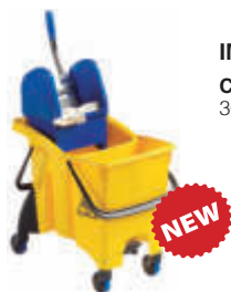
IM23740 Cubo 30 litros - 2 senos - Prensa