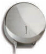
AE25500 Portarrollos higiénico industrial Futura Inox. brillo - Ø 27,7 x 12,8 cm.