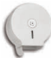
AE12100 Portarrollos higiénico industrial Chapa blanca - Ø 26,5 x 12 cm.