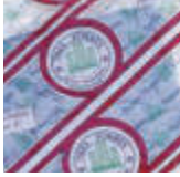
MO670436-1 Bayeta microfibra profesional azul 1 unidad