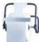
AD10000 Dispensador industrial mural 40,5 x 26,5 x 37,5 cm. Fabricado en tubo de acero de 20 mm. Sierra frontal para corte de la celulosa.