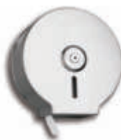
AE21000 Portarrollos higiénico industrial Inox. - Ø 26,5 x 12 cm.