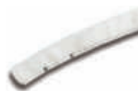
TTS8411 Recambio mojador 35 cm. Para T0008391