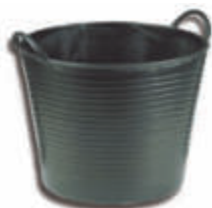
IMCES38N Capazo negro Negro - 38 litros