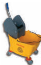
PLS1630 Cubo 30 litros - Prensa